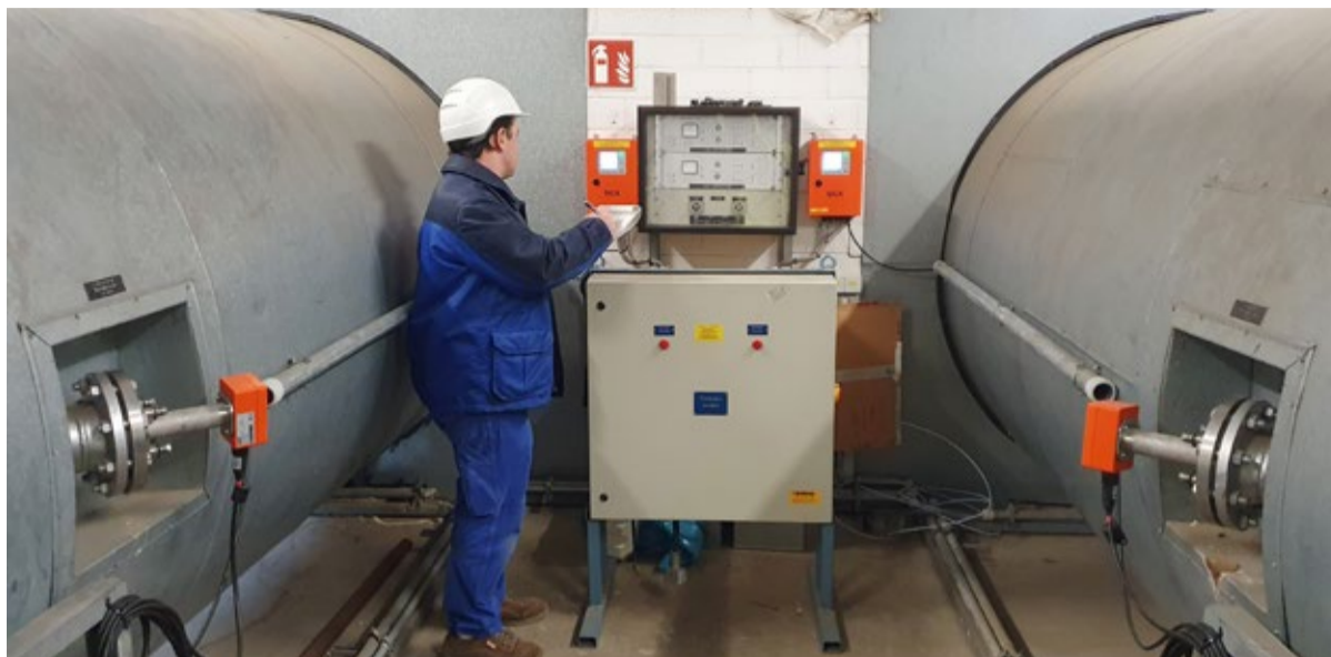
Rauchgas-Messung kurz vor dem Kamin: Die Emissionen und verschiedene Betriebswerte des MHKW Coburg werden permanent mit Hilfe von modernster Messtechnik kontrolliert und per Computer ausgewertet.

Die entsprechenden Messgeräte befinden sich jeweils kurz vor dem Kamin in einem eigens hierfür erbauten Analysegebäude. Um neben den Messungen auch die