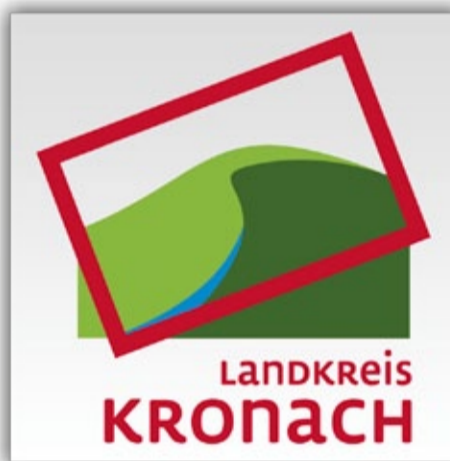
Unsere neue Abfall-App