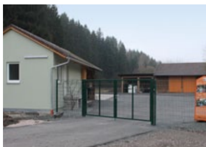
Wertstoffhof Wallenfels Hammer 5, 96346 Wallenfels

November, Dezember, Februar, März Samstag: 09.00 - 12.00 Uhr Januar: geschlossen