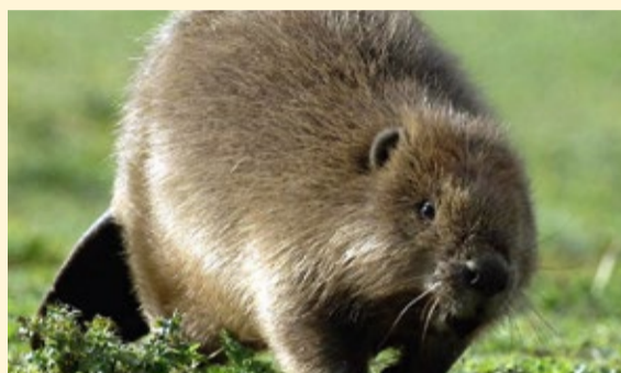
Der Biber – erfolgreicher Heimkehrer

Die wilden Kerle – sie werden sich vermutlich nie gemeinsam begegnen