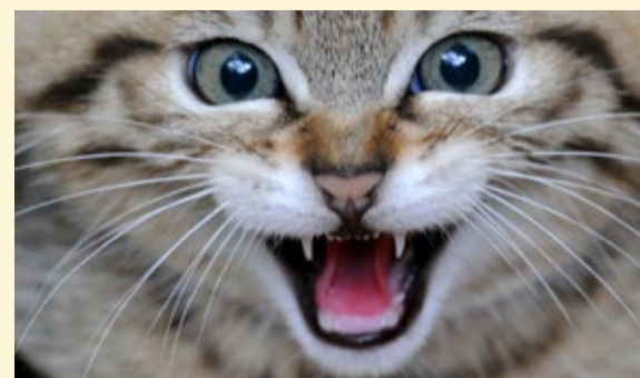
Die Wildkatze – leise Jägerin