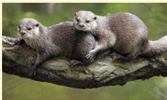
Der Fischotter – flinker Geselle