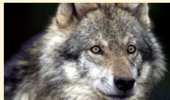
Der Wolf – ein Ureinwohner Bayerns

LANDKREIS COBURG. Viel ist die Rede von Arten, die aussterben und immer seltener werden. Dennoch gibt es Beispiele für Arten, die im Coburger Land ausgerottet worden waren und heute wieder hier leben oder gerade zurückkommen wollen. Am Beispiel von vier größeren Säugetieren soll dies erläutert werden.