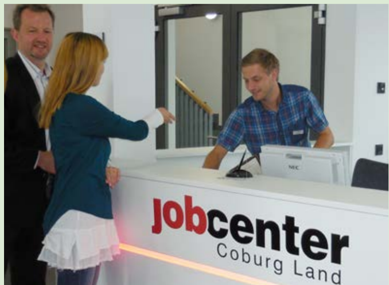
Die neue Kundentheke: Erste Anlaufstation für Jobcenter-Kunden.

kann der Kontakt mit verschiedenen Fachbereichen im Landratsamt, mit denen das Jobcenter oft zusammenarbeitet, noch schneller erfolgen. Die veranschlagten Kosten für das Neuprojekt sind im Rahmen geblieben, ebenso kam es zu keinen Verzögerungen während der Bauzeit, teilte der verantwortliche Ingenieur mit. Die offizielle Einweihung des Erweiterungsbaus ist für Ende September mit Innenminister Joachim Herrmann geplant. Service-Telefon: 095 61 / 70 52 25