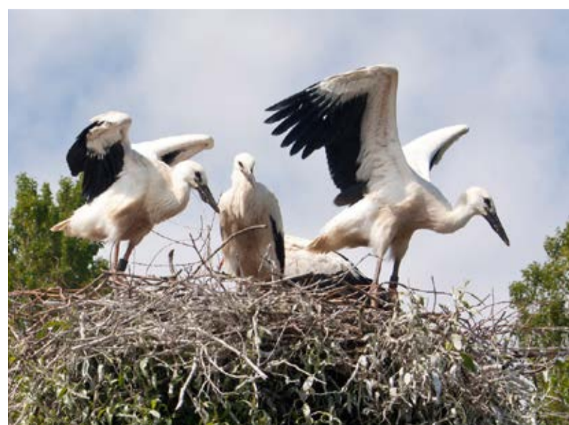
Diese Jungstörche scheinen das Wetter heute ausgiebig zu genießen.