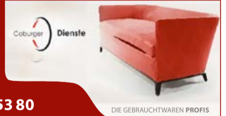
DIE GEBRAUCHTWAREN PROFIS