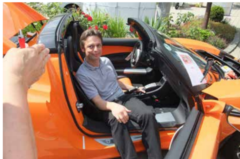
Innovative Produkte werden bei den „Sonnentagen“ anschaulich präsentiert