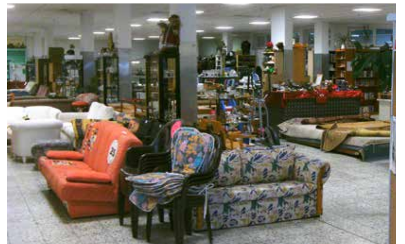
Das Gebrauchtwarenhaus der Coburger Dienste – sicher für jeden etwas dabei!

Das Gebrauchtwarenhaus präsentiert sich in neuen und freundlicheren Räumen. In der Ketschendorfer Straße 86-88 gegenüber dem Coburger Klinikum – Haupteingang und über der öffentlichen Tiefgarage finden alle Interessierten Montag bis Freitag von 8-18 Uhr viele Gebraucht Möbel und Hausrat aller Art zu günstigen Preisen und für jeden Geschmack.