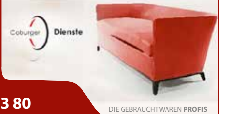
DIE GEBRAUCHTWAREN PROFIS