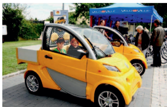
Auch bei der 15. Auflage der Lichtenfelser Sonnentage steht das Thema Elektromobilität auf der Agenda.

denn die Neugierde auf „die Flitzer der nächsten Generation“ wächst. Den Vorträgen wird in diesem Jahr wieder besondere Aufmerksamkeit geschenkt: diese werden – für jedermann verständlich – von Experten der teilnehmenden Firmen übernommen und decken die ganze Bandbreite zukunfts-fähiger Technologien ab. Der Eintritt ist frei.